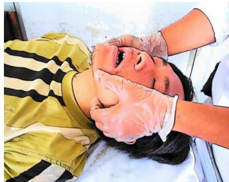
Gb. Jaw Thrust